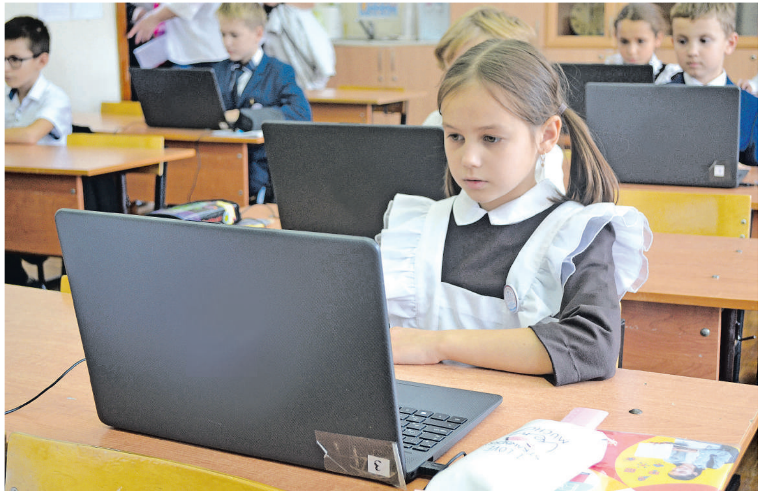
С 1 сентября основы программирования в 13-й школе изучают ученики с 1-го по 8-й класс

К слову, о школьном музее, где хранится на выходных государственная символика. Созданный более 30 лет назад (а восемь лет назад он пережил реконструкцию) Музей боевой славы 23-го гвардейского Белгородского Краснознамённого авиационного полка дальнего действия объединил детей, внуков и правнуков ветеранов полка. Центр внеурочной и исследовательской деятельности дал ребятам, увлечённым краеведением и историей, на опыте понять: их поисковая работа действительно нужна людям! Так,