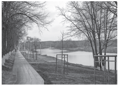
Набережная в Шебекино

ПУТЕШЕСТВИЯ ПО РОДНОМУ КРАЮ КАК ПУТЬ К ПАТРИОТИЗМУ