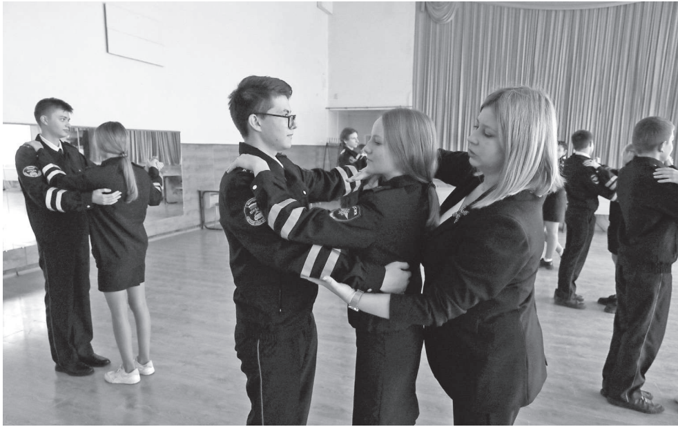
Занятие по хореографии