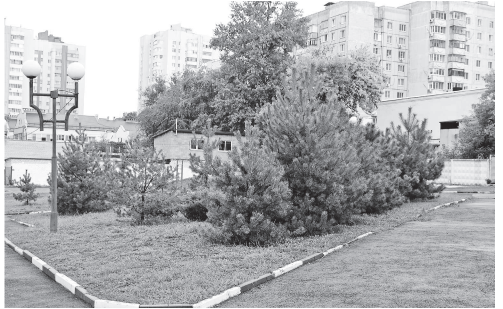
Школьный сосновый бор

движения не на уровне «красный — стоп, жёлтый — приготовиться, зелёный — иди». А, если можно так выразиться, углублённо. Более того, занятия по ПДД с ребятами проводят сами госавтоинспекторы.