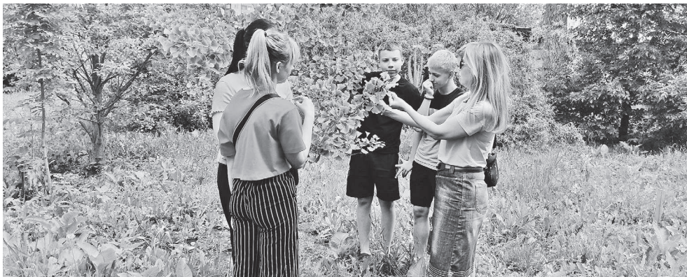
Старооскольские юннаты изучают реликтовое дерево гинкго во время экспедиции «По тропинкам родного края».