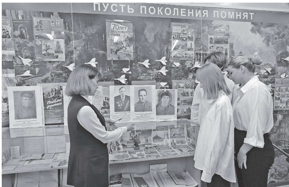
В школьном военно-патриотическом музее

Внутри школы светло и просторно. Несмотря на то что в этом учебном году 48-я школа приняла ребят и педагогов из школы № 45 — там идёт капитальный ремонт.