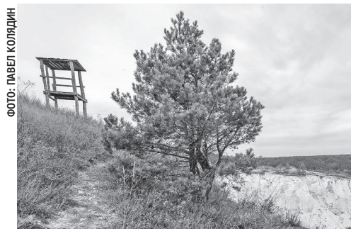
Меловая сосна Бекариюковского бора в Шебекинском городском округе