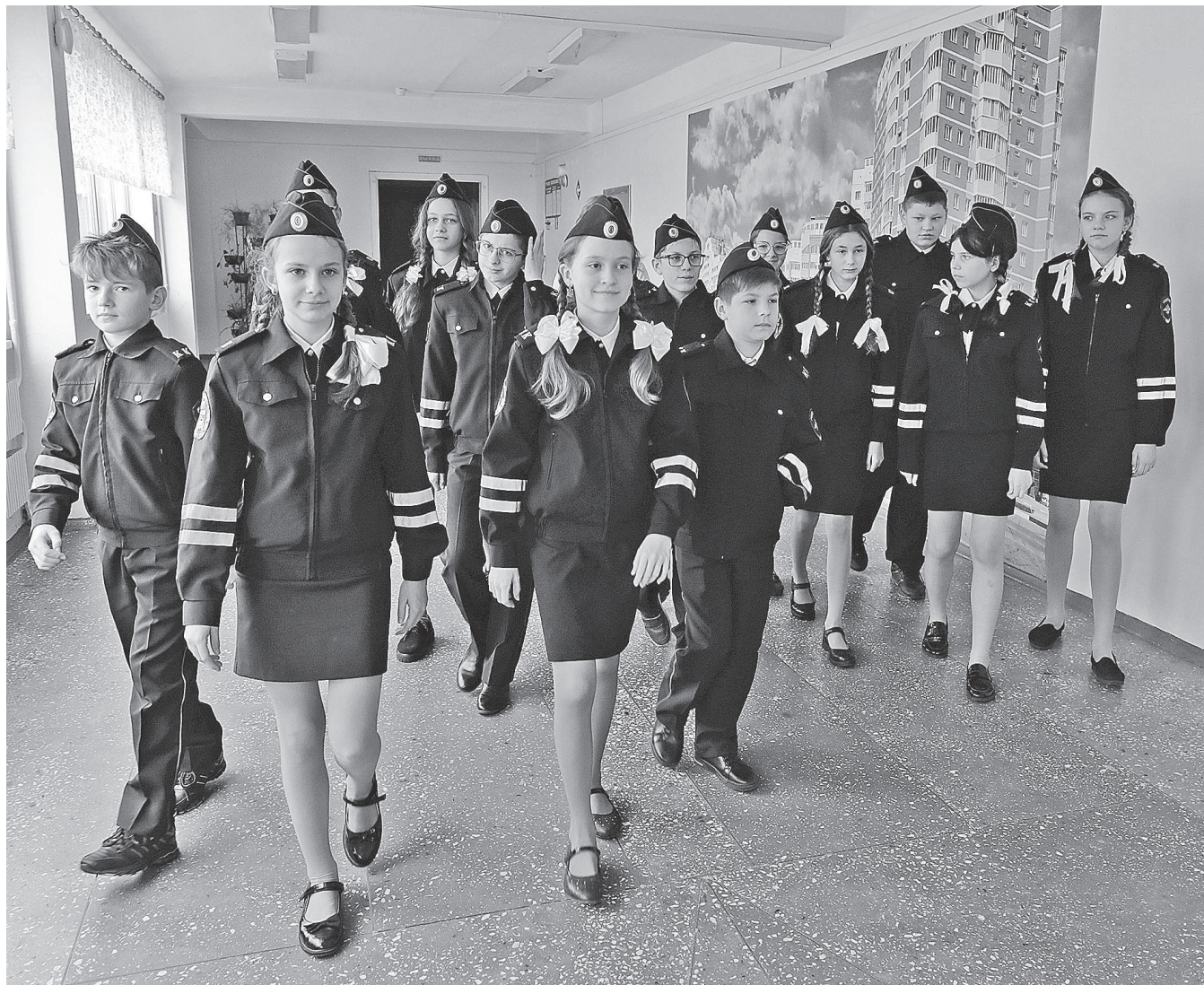
Ученики кадетского класса

ЗА ЧТО МАЛЬЧИШКИ И ДЕВЧОНКИ ЛЮБЯТ СВОЮ ОБЫЧНУЮ ШКОЛУ № 48