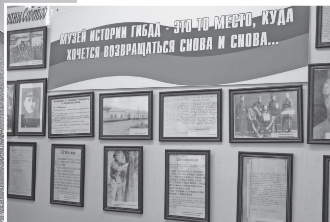
В школьном музее истории ГИБДД

«Да, это обычная школа!» — часто можно услышать в адрес учебного заведения, которое не лицей, не гимназия, не центр образования, а действительно — обычная общеобразовательная школа. Только вот произносить эти слова нужно не с оттенком пренебрежения. А, представьте себе, с гордостью: да, школа обычная, но почему же сюда стремятся дети не только из микрорайона, но и из крутых школ часто переходят? Почему все учебные места заполнены и детские папки с портфолио не вмещают всех дипломов, грамот, благодарностей?