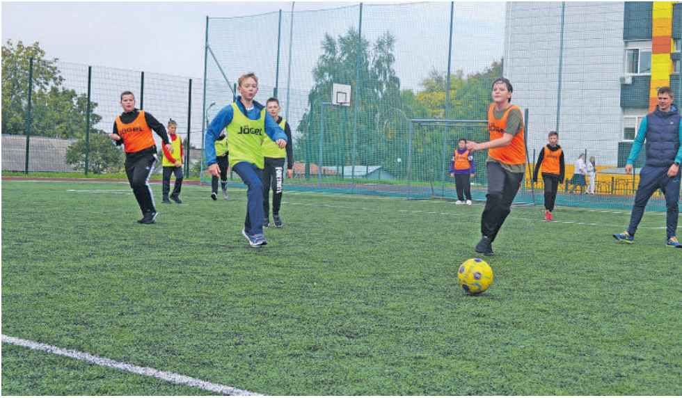
В рамках губернаторского проекта «Решаем вместе» в 13-й школе к 1 сентября открыли новую спортивную площадку с беговыми дорожками, футбольным, баскетбольным полями и даже воркаут-зоной. В планах — доделать разметку на площадке для малышей и зону для игры в теннис

галочки или хорошего отзыва в соцсетях или на бумажном бланке, а по велению души. Иначе не могут. И когда мы заглянули напоследок в кабинет информатики, где собрались «звёздочки»-старшеклассники (к слову, многие планируют связать свою жизнь с IT-специальностями, уверены: за ними будущее), и спросили: «А почему