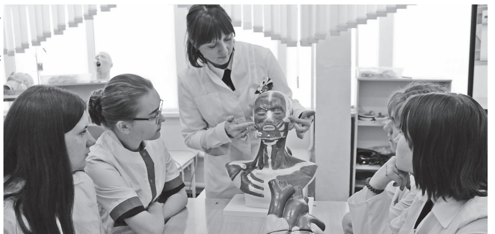
На занятиях в медклассе Валуйской школы № 4

бре учителя химии проходят курс «Химический эксперимент как метод естественно-научного познания в условиях ФГОС СОО».