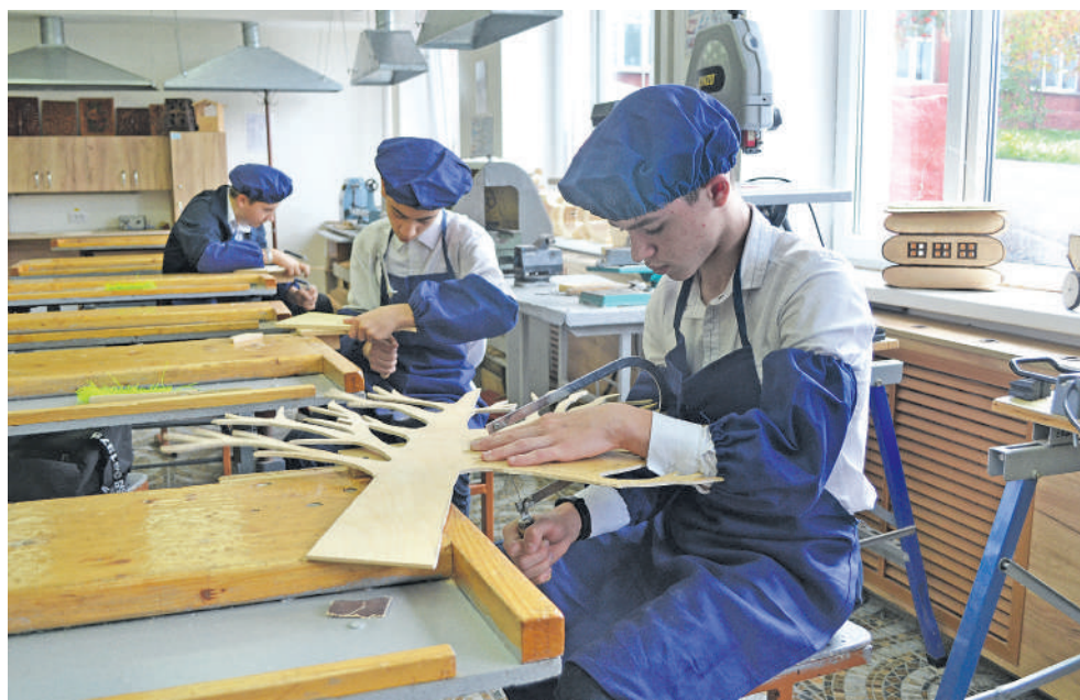
В школьной мастерской