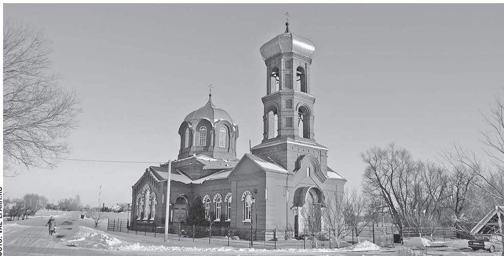
Храм святителя Тихона Задонского в селе Нижняя Серебрянка Ровеньского района

К примеру, с 20 по 24 июня проходила летняя экологическая экспедиция «По тропинкам родного края». Ребята успешно справились с задачами, стоящими перед экологической экспедицией: сформировать определённый объём знаний по экологии, приобрести навыки научного анализа явлений природы, осмысления взаимодействия общества с природой, осознать значимость своей практической помощи природе. Формирование таких качеств особенно эффективно происходит в процессе самостоятельной поисково-исследовательской деятельности.