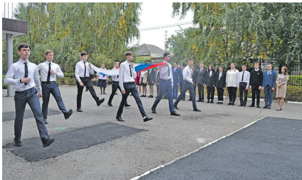
В 13-й школе, как и по всей России, новую учебную неделю начинают с поднятия гостфлага и исполнения гимна РФ